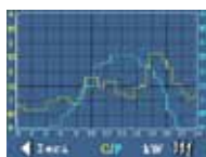
Grafico produzione e consumi

Misurazione assorbimenti e gestione auto-consumo